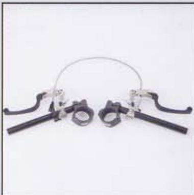
PVM Hauptbremszylinder mit Flip up Lever und Fernverstellung

PVM radial brake master cylinder with flip up lever and remote adjuster