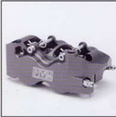
PVM 4 Kolben Monoblock Bremszange mit 4 Einzelbelägen / 108mm Montageabstand

PVM 6 Piston Monoblock radial mount calliper 108mm pitch