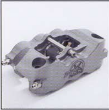
PVM 6 Kolben Monoblock Bremszange, radial befestigt 108mm Montageabstand

PVM 6 Piston Monoblock radial mount calliper 108mm pitch