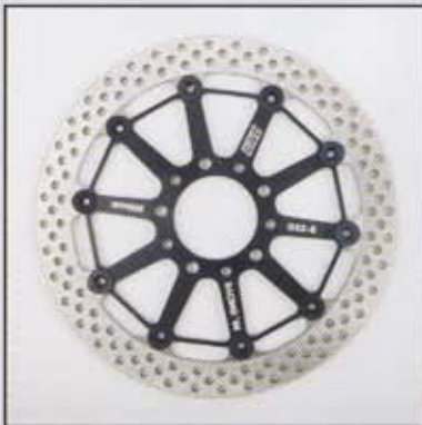
PVM Racing Bremsscheibe schwimmend, Stahl

PVM 4 piston Monoblock radial mount calliper 108mm pitch