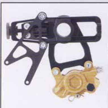
Kettenspannsystem mit PVM 2 Kolben Sattel und Bremsscheibe

PVM radial brake master cylinder with flip up lever and remote adjuster